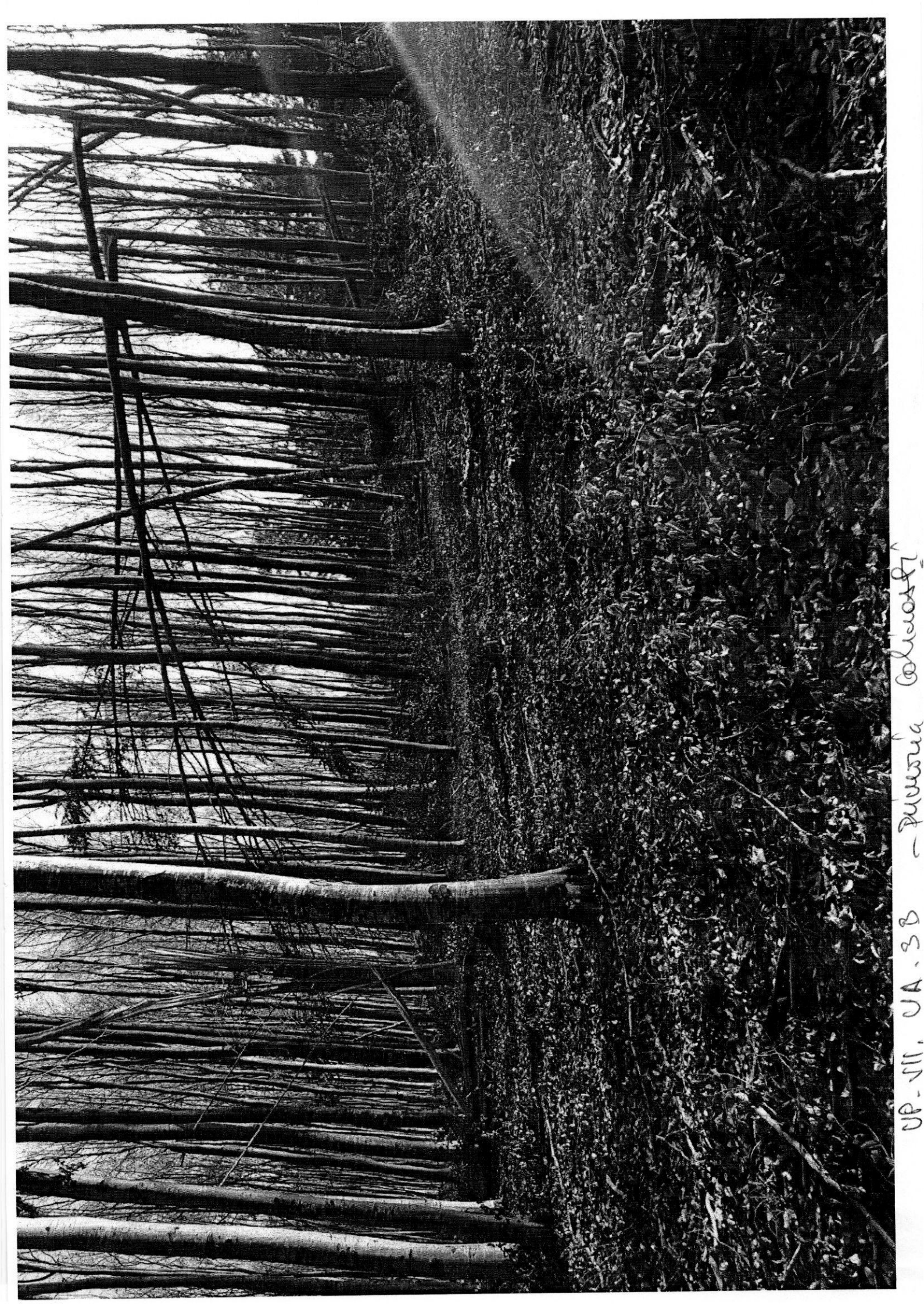
UP. III. VA. 3B - Pinus Coluosa